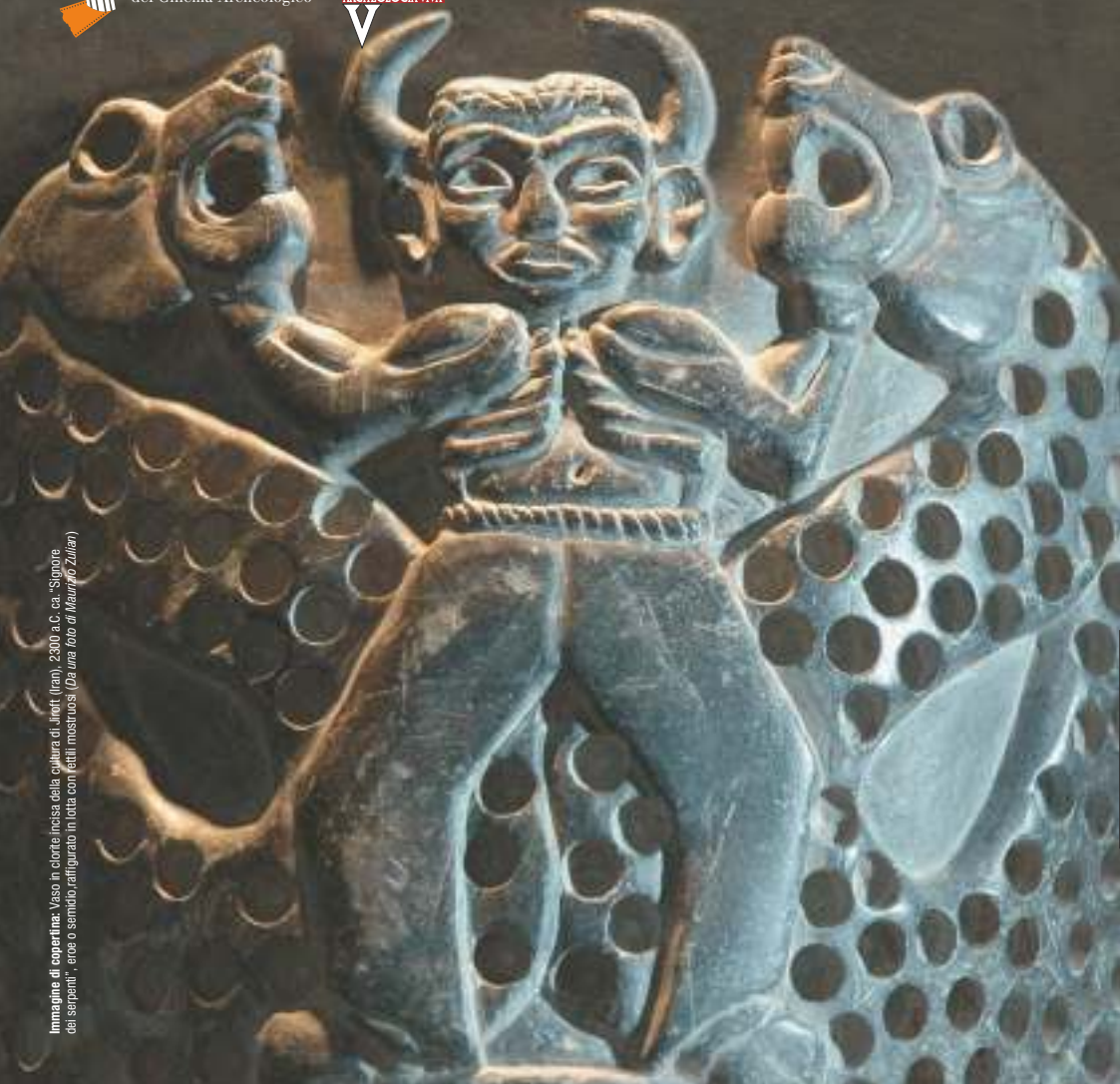
Immagine di copertina: Vaso in ciotole incisa della cultura di Vinča (Iran, 2300 a.C. ca. -Signore dei serpenti", eroe o semidio raffigurato in lotta con fletti mostruosi)