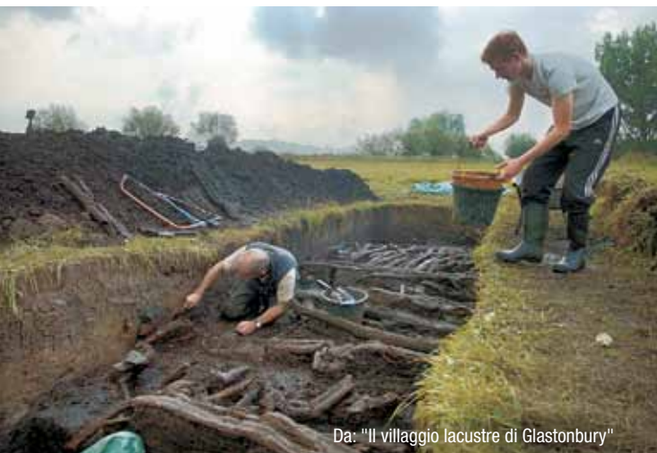
Da: "Il villaggio lacustre di Glastonbury"