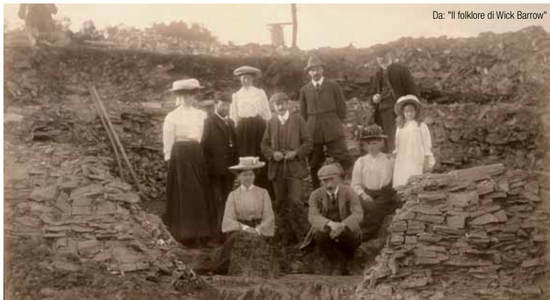
Da: "Il folklore di Wick Barrow"

15.000 anni or sono, le acque prodotte dallo scioglimento delle calotte polari ricoprono il 15% dell'Australia. Ciò ebbe profonde ripercussioni sui Tasmanidi, rimasti isolati dal mondo, sulla loro lingua, sul loro cibo e le loro tecniche. Con il ricollegamento successivo al continente cominciarono a sviluppare i commerci attraverso lo stretto di Torres e presto l'arrivo di Olandesi e Francesi produssero effetti devastanti.