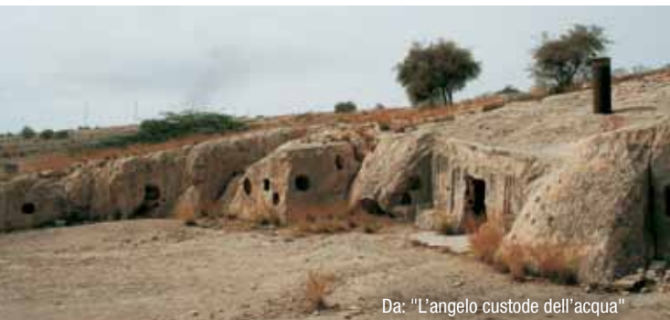
Da: "L'angelo custode dell'acqua"

Per migliaia di anni gli abitanti di Deylam, nel nord dell'Iran, hanno creduto nel Mitraismo e in altri culti solari. Nonostante la presenza storica dello Zoroastrismo e dell'Islam le profonde radici delle credenze religiose primordiali hanno continuato a vivere spiritualmente e culturalmente nelle cerimonie e con un arcaico corredo simbolico.