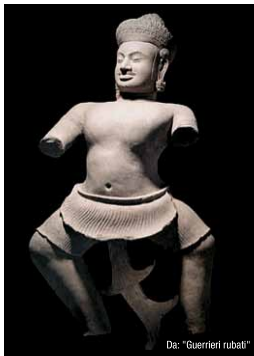
Da: "Guerrieri rubati"