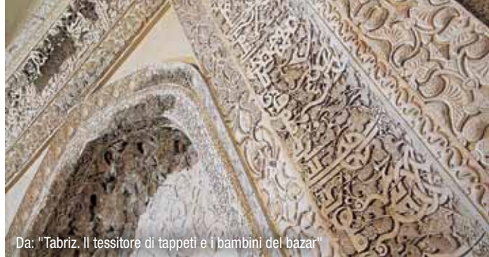
Da: "Tabriz. Il tessitore di tappeti e i bambini del bazar"

Documentario girato nel 1992 e nel 2000 in Siria, terra del passato per eccellenza, crocevia tra Africa ed Europa dove si sovrapposero le più splendide civiltà: Ebla, Damasco, Palmira, Aleppo... Esistono ancora questi splendidi siti e in quali condizioni?