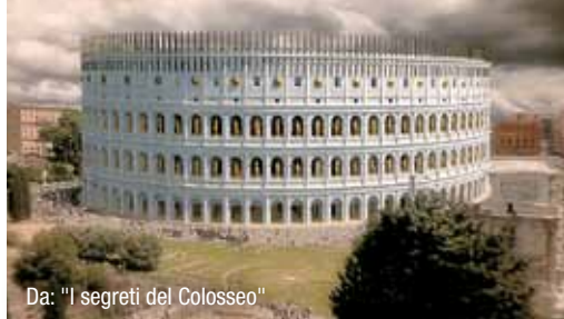
Da: "I segreti del Colosseo"

Il gruppo "Musica Romana" ha fatto questo concerto dentro il Museo Germanico Romano a Mainz, basandosi solo sui 60 frammenti di pezzi di musica con notazione antica. Ma solo la melodia si è conservata. Sulla base di questi frammenti conservati hanno composto la musica.