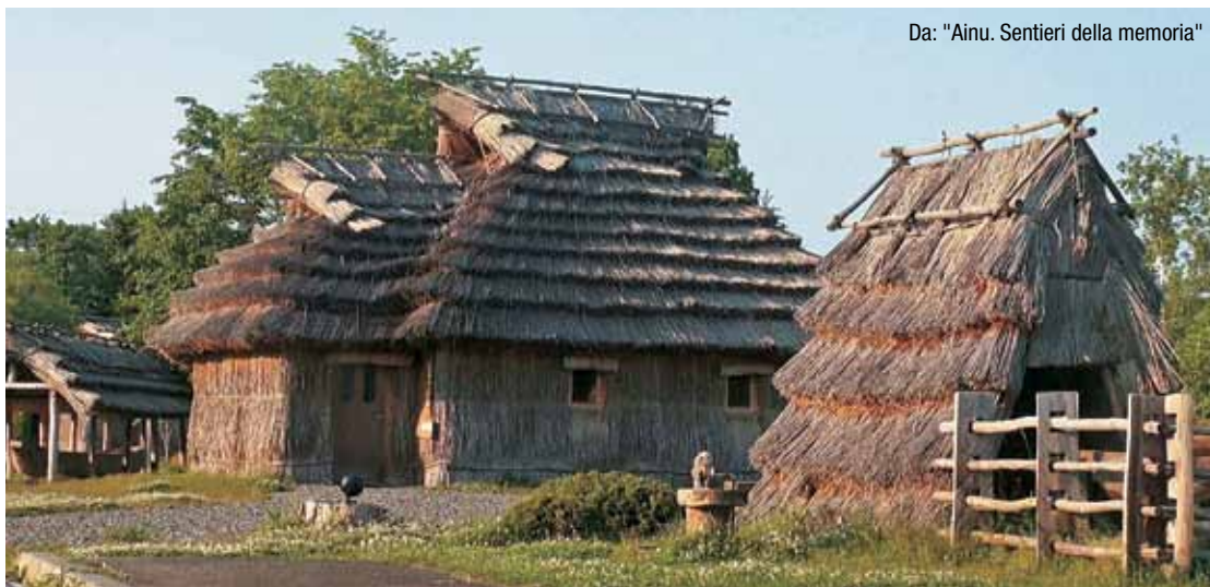
Da: "Ainu. Sentieri della memoria"

Il punto dove ebbe luogo una battaglia navale tra Svezia e Danimarca e il numero delle navi affondate sono rimasti ignoti per 300 anni. Nel 2011, un team di archeologi e storici ha battuto le acque del Baltico e scavato negli archivi navali di Svezia e Danimarca, scoprendo così diversi relitti della battaglia e documenti che descrivono l'accaduto. Con le riprese dei lavori e le ricostruzioni digitali dei relitti, il film rivela i segreti di una delle più grandi battaglie navali del Baltico.