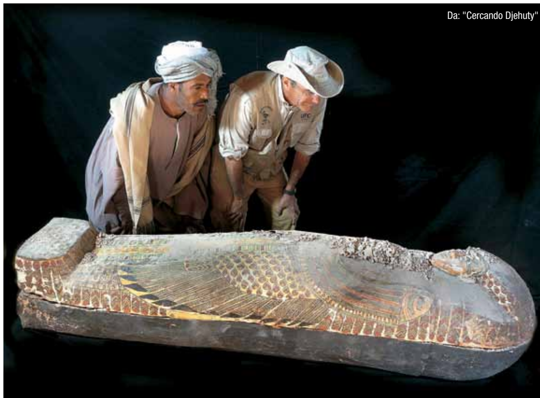
Da: "Cercando Djehuty"