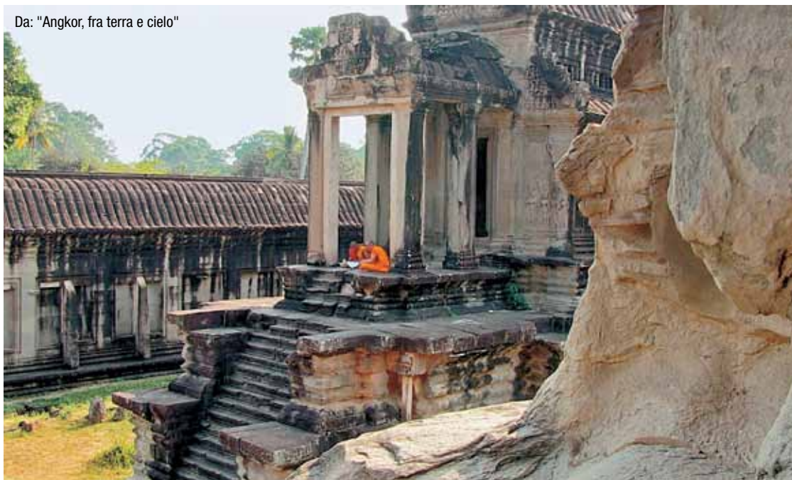
Da: "Angkor, fra terra e cielo"