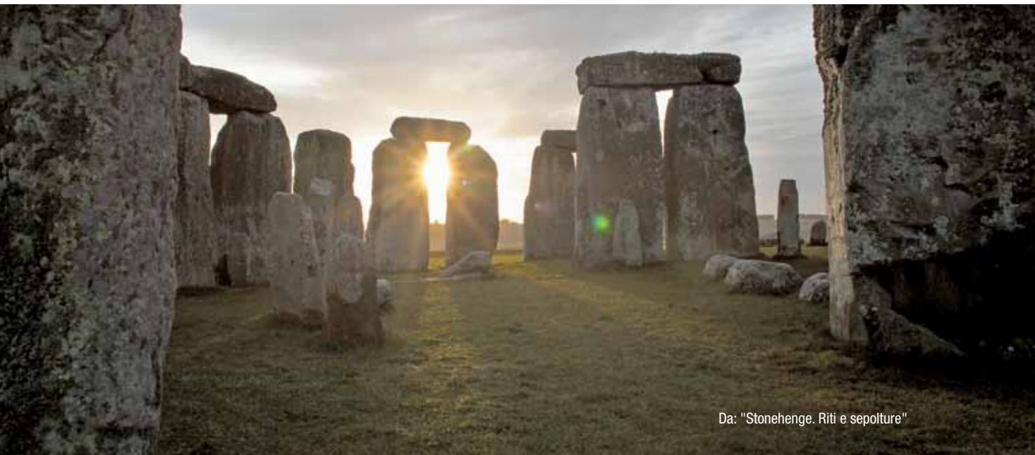
Da: "Stonehenge. Riti e sepolture"

Documentario etnografico molto poetico che prova a raccontarci la storia dell'isola di Kharg, nel sud dell'Iran, e dei suoi abitanti. È anche però una denuncia dell'inquinamento e della vita misera che conducono gli indigeni al giorno d'oggi rispetto ai loro antenati.