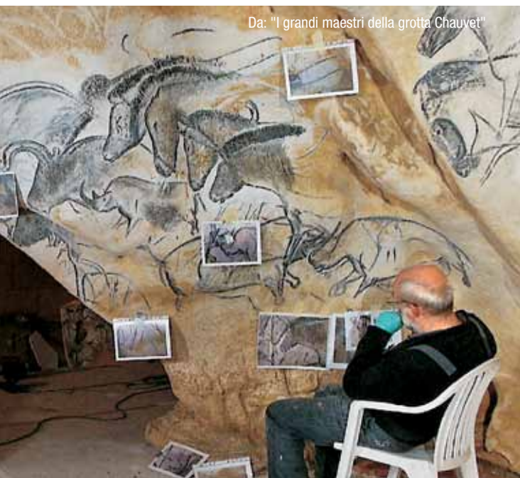
Da: "I grandi maestri della grotta Chauvet"

I disegni e le pitture della grotta Chauvet, vecchi di 36 mila anni e scoperti vent'anni fa nel sud della Francia, sono a oggi la più antica espressione artistica umana. La loro forza e modernità hanno radicalmente modificato tutte le idee che avevamo sull'arte preistorica. La creazione di un importante museo dedicato alla riproduzione di queste opere consente una visione ravvicinata delle pitture, dei disegni e delle incisioni. Il filmato ci consente di capire le incredibili tecniche utilizzate e di sentire il loro intatto potere emotivo.