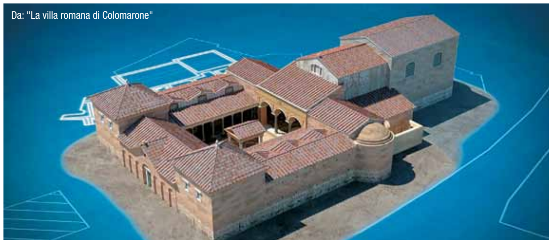
Da: "La villa romana di Colombarone"

I resti romani dell'imponente Capitolium di Verona vengono descritti grazie al racconto in prima persona di Scipione Maffei in costume d'epoca. La descrizione dell'area archeologica di Corte Sgarzerie passa attraverso una complessa stratificazione architettonica. Il video è frutto di un grande lavoro di computer grafica e ricostruzioni virtuali.