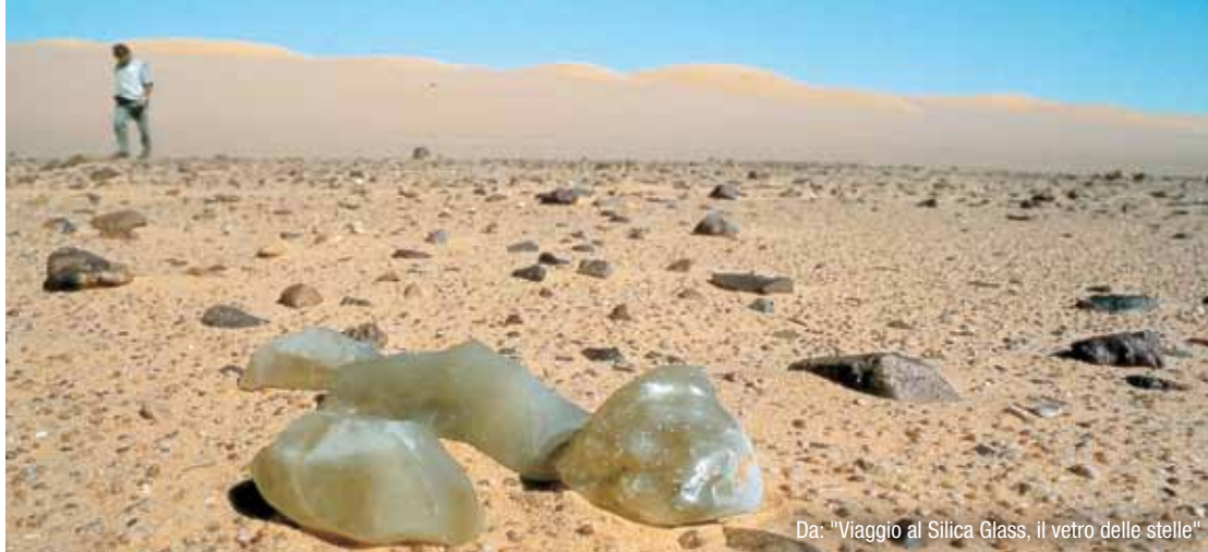
Da: "Viaggio al Silica Glass, il vetro delle stelle"