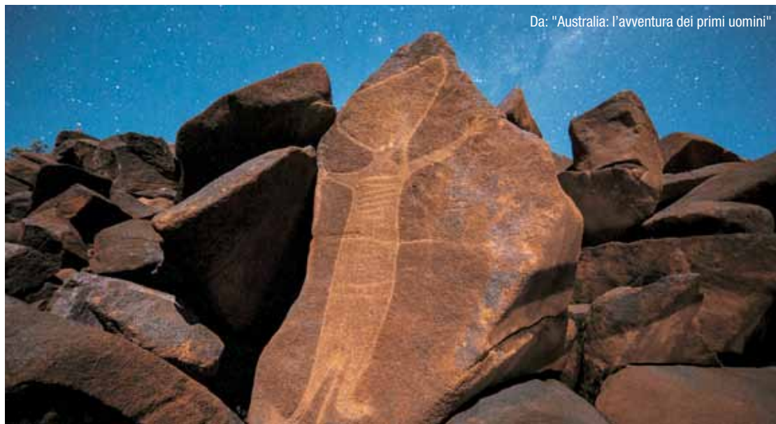
Da: "Australia: l'avventura dei primi uomini"

Il tumulo sepolcrale preistorico noto come Wick Barrow ha oltre 5000 anni. Questo documentario descrive il folklore associato al sito e gli scavi archeologici effettuati all'inizio del XX secolo dalla Archaeological and Natural History Society del Somerset. Il film contiene un'intervista a Victor Ambrus, colui che ha creato una ricostruzione di come sarebbe potuto apparire il tumulo archeologico oltre 4000 anni fa.