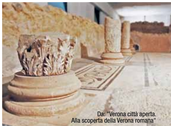
Da: "Verona città aperta. Alla scoperta della Verona romana"