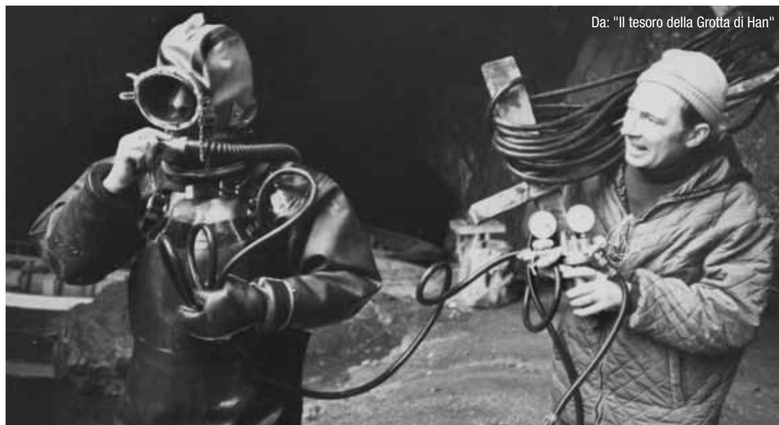
Da: "Il tesoro della Grotta di Han"

In tutta la Sardegna si contano le rovine di oltre settemila torri circolari. Sono i Nuraghi, silenti testimoni di una cultura megalitica le cui prime torri sono state costruite attorno al 1400 a.C. I pastori sardi conservano ancora un'antica arte del canto, la chiamano "Cantu a tenore", che si ritiene possa risalire alla cultura nuragica.